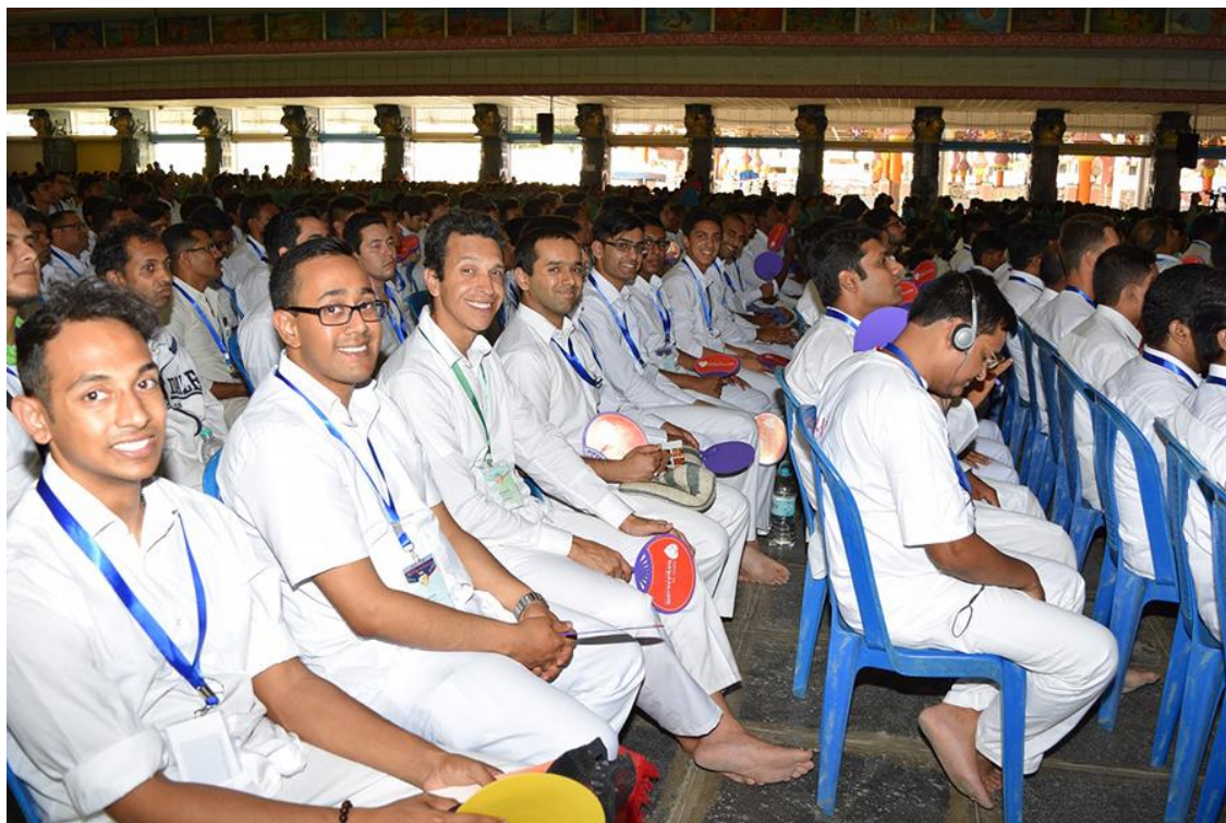
Skup u dvorani Poornachandra

Nakon toga je puštena snimka dijela božanskog govora Sathya Sai Babe, kojom se sve podsjetilo na to da je istina jedna i ista u cijelom svijetu. Pored toga, najbolji put za voljeti Boga je putem najvišeg oblika duhovne vježbe – sadhana , pretvaranjem ljubavi u služenje. Jutarnji je program završio pjevajnjem Bhajana i izvođenjem Mangala Arathija .