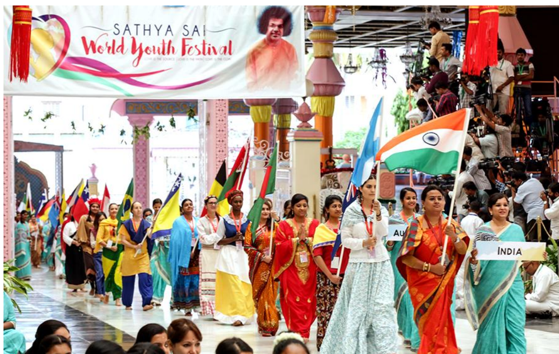
Povorka sa zastavama zemalja iz kojih su stigli sudionici

U svojem uvodom obraćanju, Dr. Shivendra Kumar, Međunarodni koordinator za mlade pri Sathya Sai međunarodnoj organizaciji nadahnuto je podsjetio sve sudionike na njihovu dobru sreću jer pripadaju Sathya Sai mladima. Spomenuo je četiri cilja festivala koji su: slaviti radost što su upoznali Sathya Sai Babu u mladoj životnoj dobi, slaviti Njegov život i učenje, sačuvati Njegovu poruku kroz nove inicijative i surađivati sa starijima u Organizaciji kako bi učili i rasli. Kazao je kako je više od 320 dobrovoljaca naumorno radilo tijekom posljednjih šest mjeseci kako bi omogućili uspješno održavanje ovog festivala.