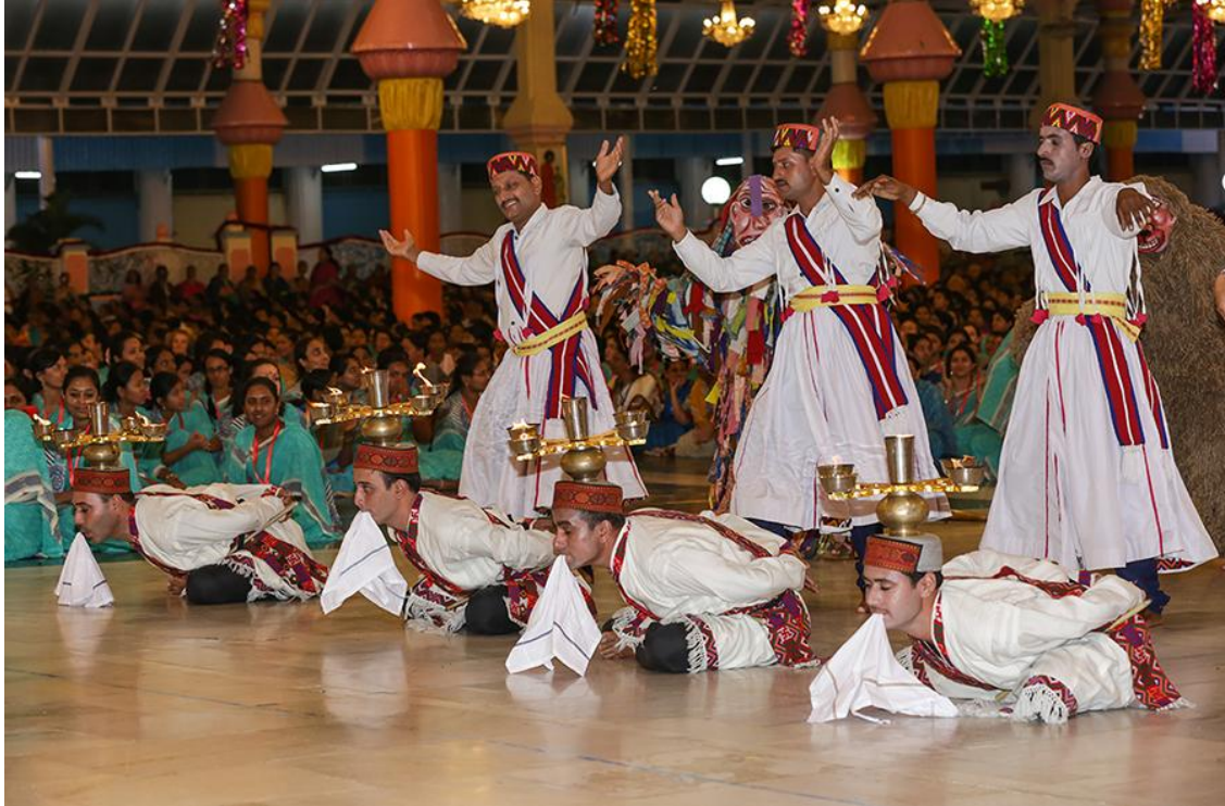
Multikulturalni glazbeno plesni program