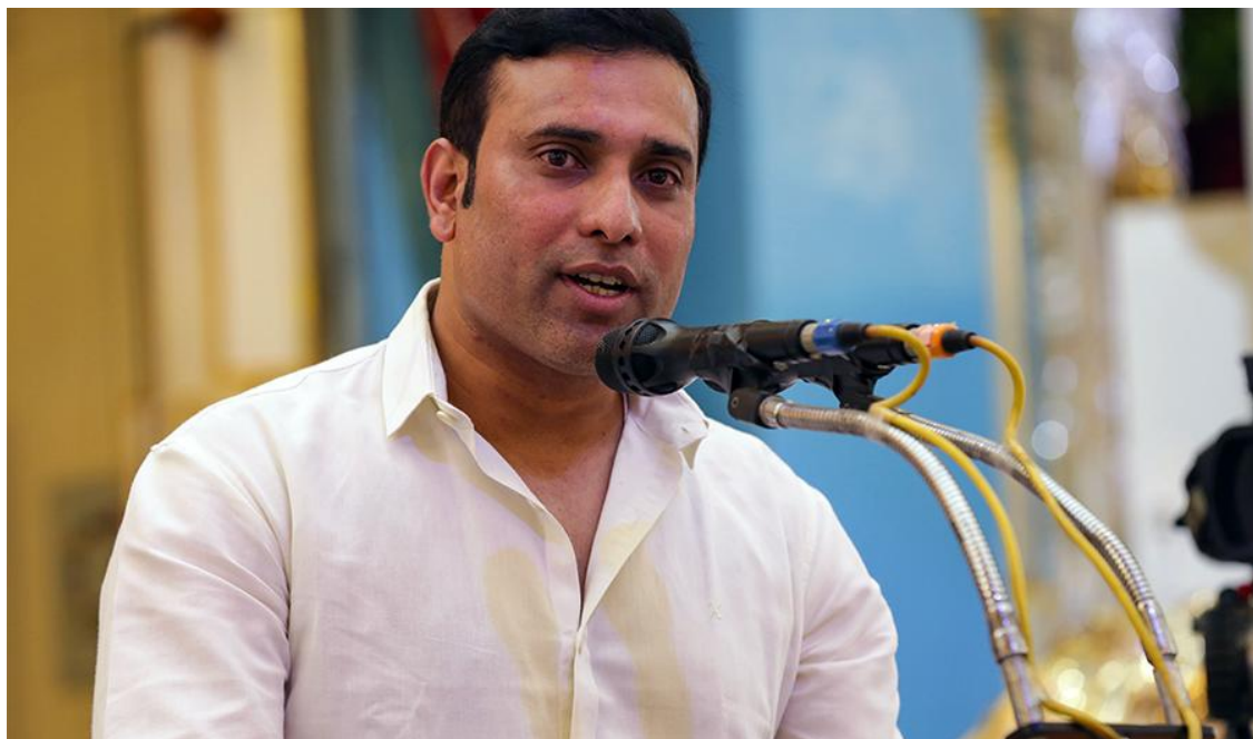
Gospodin V.V.S. Laxman

Prvi dan Sathya Sai svjetskog festivala mladih završio je živopisnim i umjetničkim kulturnim nastupom pod nazivom 'Ples u skladu s božanskim ritmom - Dancing to the Divine Rhythm – na Saijev način. Mladi iz Ujedinjenih Arapskih Emirata, Nepala, Mauricijusa, Indonezije, Fijija i drugih zemalja u okviru Indije Rajasthana, Manipura, Gujrata i Punjaba zadivili su okupljene svojom umjetničkom izhvedbom i svojom energijom.